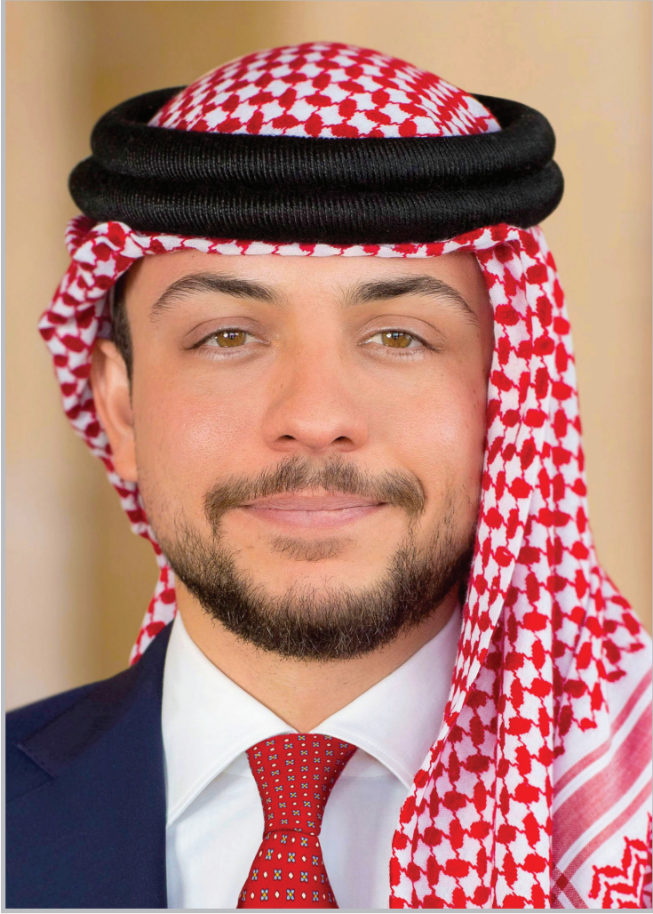
حضرة صاحب السمو الملكي الأمير حسين بن عبد الله الثاني ولي العهد