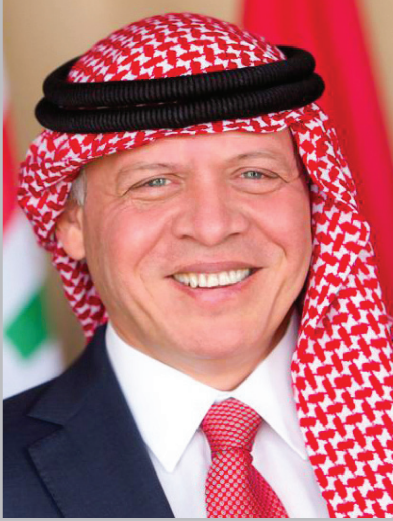
حضرة صاحب الجلالة الملك عبد الله الثاني ابن الحسين